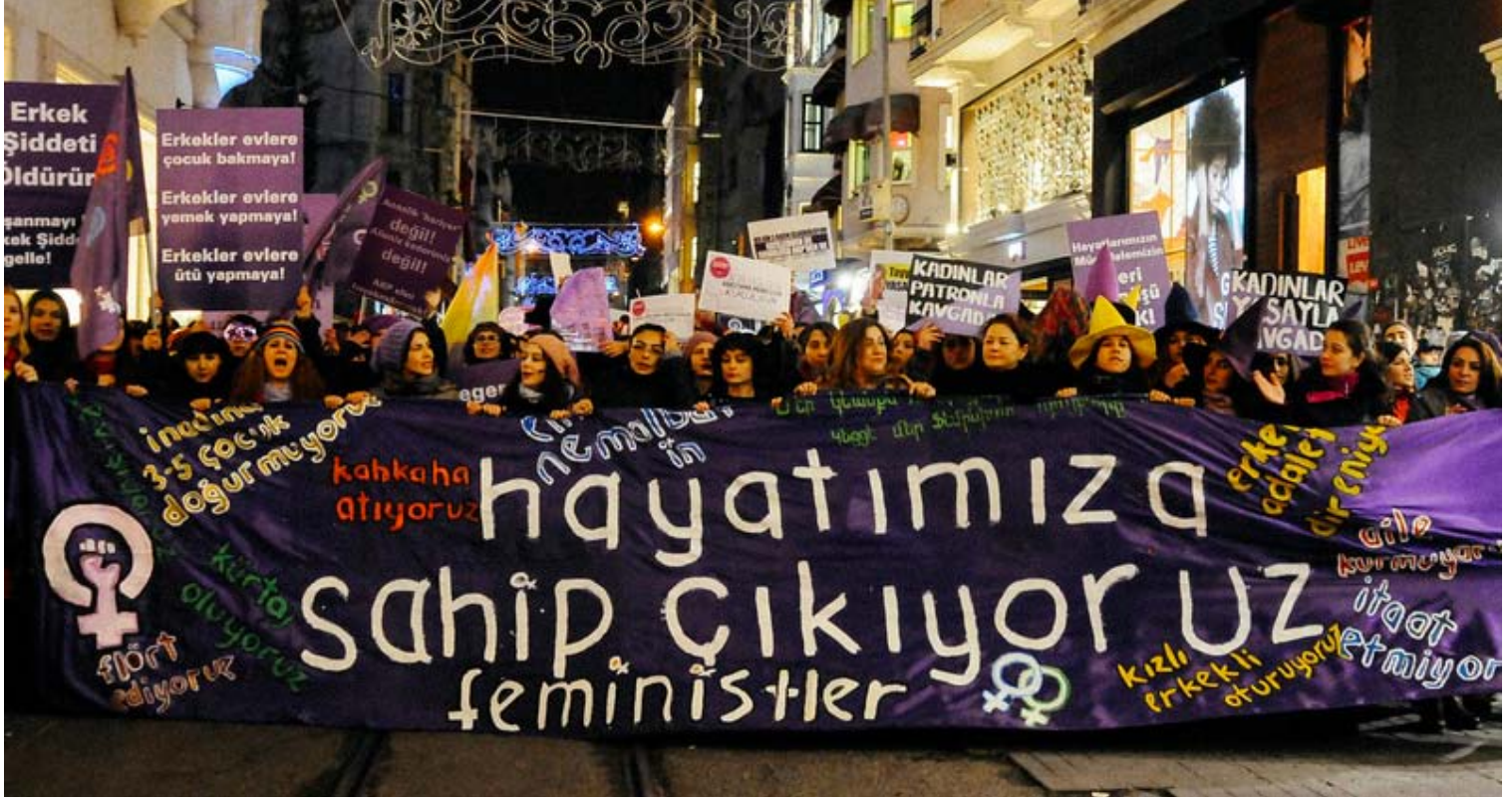
8 Mart Gece Yürüyüşü. İstanbul 2015